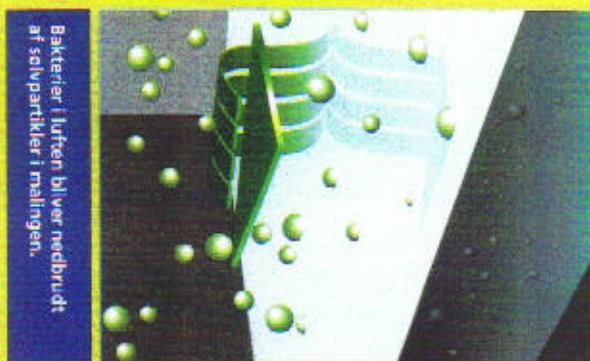
Bakterier kommer i kontakt med SigmaCare Immun og indkapsles i malingsfilmen, hvorefter nedbrydning finder sted.

Produktet har særdeles god dækkeevne, er vaskbar, har gode arbejdssegenskaber og fremstår med en yderst flot overflade.